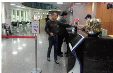
於大廳辦理「員工美食門禁卡」