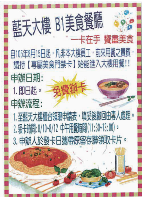
美食門禁卡宣傳海報