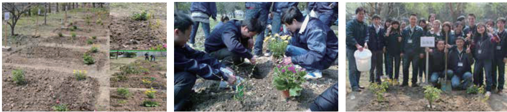
員工植樹造林活動

2014 年透過整理昆山製造廠區內之閒置空地，以處為單位號召，邀集 200 位同仁捲起袖子植樹種花，落實環境綠化，並期藉此喚起員工環境保護與愛護地球之意識。