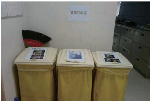
台北總部各樓層之資源回收區

藍天響應政府垃圾分類精神，平日在公司提醒同仁做好垃圾分類，並於我們台北總部大樓每一樓層皆設置資源回收區，每周 2 次定期請佛教慈濟慈善基金會來回收紙類、塑膠容器、廢電池及包材等，以減少垃圾量，由慈濟將可回收之垃圾資源化。2014 到 2016 年透過同仁們每天隨手做愛心，資源回收物資販售的金額共計新台幣 289,100 元，全數捐贈予慈濟作慈善公益用途。