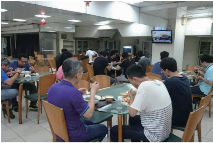
員工餐廳用餐環境

除了提供免費場地協助扶植當地弱勢團體，我們亦於 2016 年開始，開放台北總部大樓之員工餐廳，讓大樓內承租戶、鄰里居民及其他鄰近辦公大樓之人員皆可至我們的員工餐廳享用美味又優惠之餐點；截至 2016 年底，已有 221 位附近鄰里辦公大樓的人員至公司辦理「員工美食門禁卡」，讓交通較不便之商辦區域，多了一個用餐選擇。