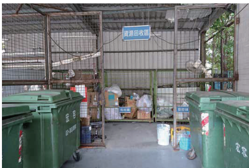
台北總部之資源回收區