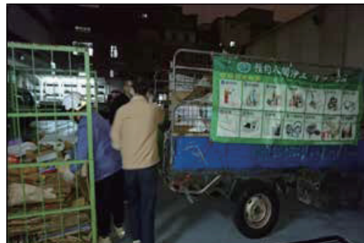
慈濟慈善基金會資源回收車到廠內收取回收物資