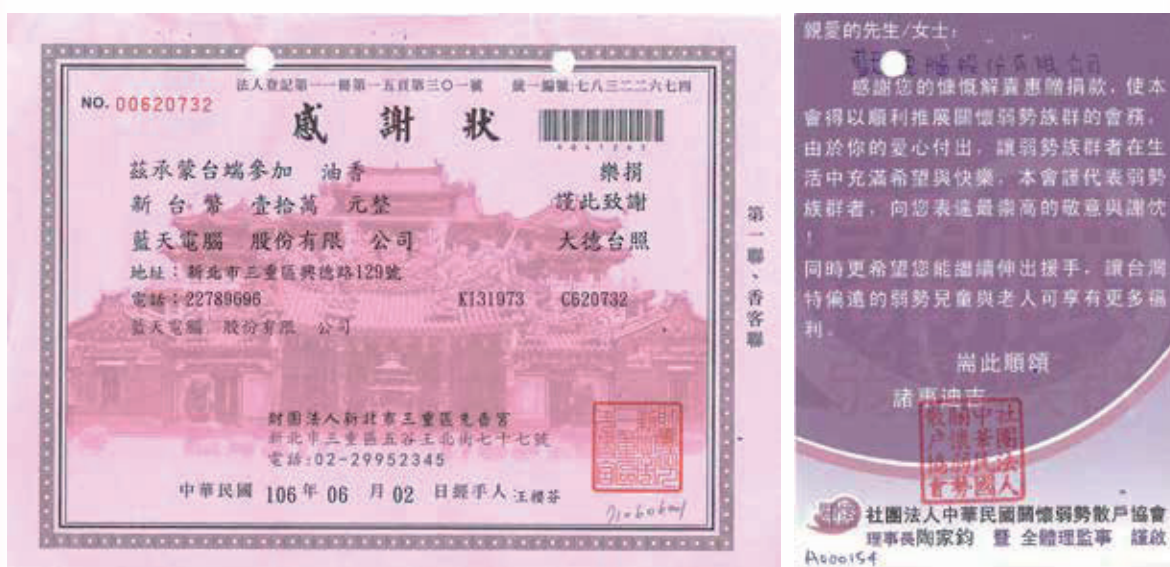
歷年慈善公益捐贈

我們積極參與慈善捐款，並協助當地政府興建地方建設，2017年我們共捐贈新台幣339,000元。另我們亦免費提供藍天總部大樓空間予當地居民及公益團體等，透過擺攤等活動方式，彼此互相交流，一同為社會公益盡心盡力，打造美好的藍天社區。